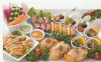
洋風オードブル 3名様 5,500円 (税込価格6,050円)