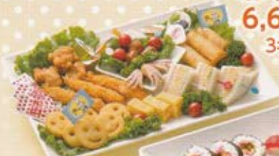
6,600円(税込価格7,260円) 3名様 ※単品としてもご注文を承っております。