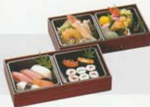
導師様用折詰 A 5,500円(税込価格6,050円)

御用途限定品の為、使途や数量によってはご注文を承れない場合もございます。ご了承いただけますようお願い申し上げます。