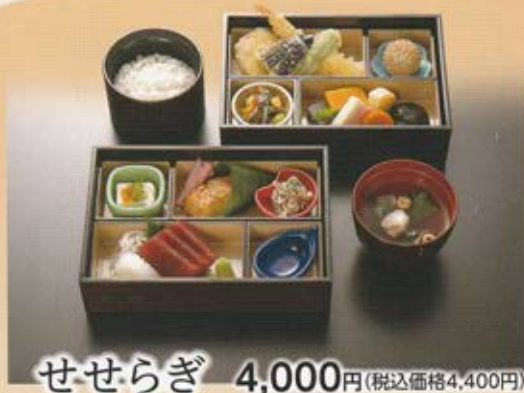
せせらぎ 4,000円(税込価格4,400円)