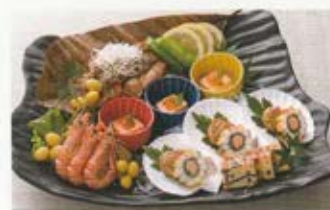
和風オードブル 3名様 5,500円 (税込価格6,050円)