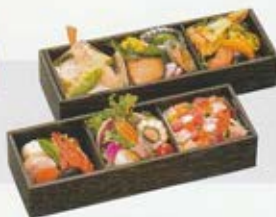
導師様用折詰 B 5,500円(税込価格6,050円)

※保健所の指導により、折詰以外のお料理の持ち帰りはお断りしております。 ※季節・仕入れの状況によりお料理の内容や器が変わる場合がございます。 ※花や動物等は商品に含まれておりません。