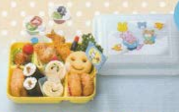
お子様ランチ 2,200円(税込価格2,420円)