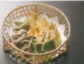
天ぷら 3名様 5,500円 (税込価格6,050円)