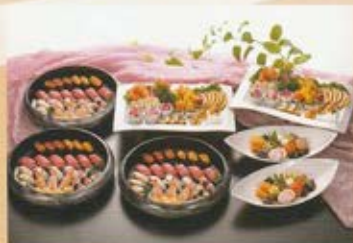
さくら 桜セット 8~10名様