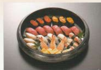
特上寿司盛合せ 3名様