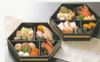
煮物 5名様 6,500円 (税込価格7,150円)