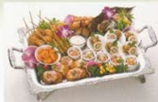
ミックスオードブル 5名様 13,000円 (税込価格14,300円)