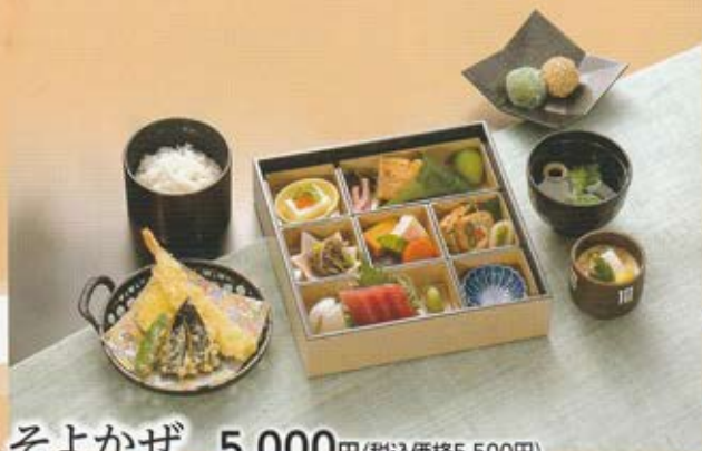
そよかぜ 5,000円(税込価格5,500円)