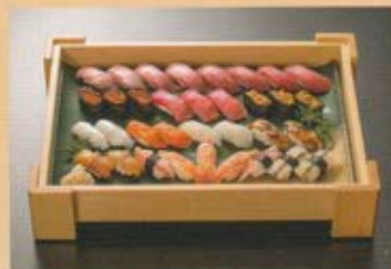
上寿司盛合せ 4~5名様