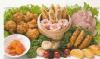
中華オードブル 3名様 5,500円 (税込価格6,050円)